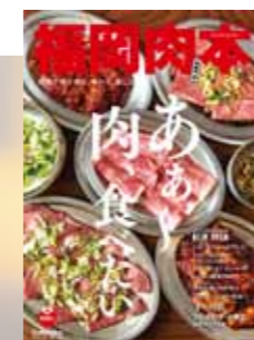
2018年 第5弾 肉本表紙

2019年も肉のニュースは話題の中心に! 「福岡肉本」は、おかげさまで5号目を迎えることができました。今年は例年以上の肉情報を盛り込みつつ、より読者の目線に立ち、「これ一冊あれば肉情報はOK!」、実際に「使える肉本!」を目指して、一人でも多くの肉LOVERを虜にできる一冊に仕上げていきます。