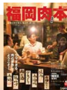
2017年 第4弾 肉本表紙