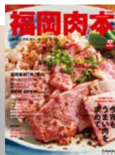
2016年 第3弾 肉本表紙