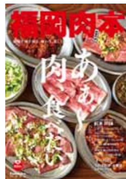
2018年 第5弾 肉本表紙

媒体名 / 福岡肉本 2019 発行日 / 2019年7月31日(水) 装丁 / A4(297mm×210mm)、112ページ(予定) 部数 / 50,000部 価格 / 640円+税 期間 / 1年間 販売 / 福岡県下の書店・コンビニエンスストア