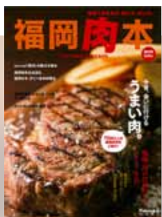
2014年 第1弾 肉本表紙