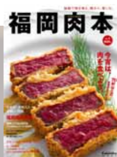
2015年 第2弾 肉本表紙