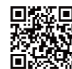
シティ情報ふくおか facebook